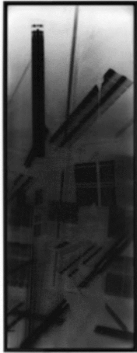
Exposure 03 (Galerie Bart) 2019.03.28-2019.04.08, digital satin print op dibond, ingelijst, 106 x 38 cm.