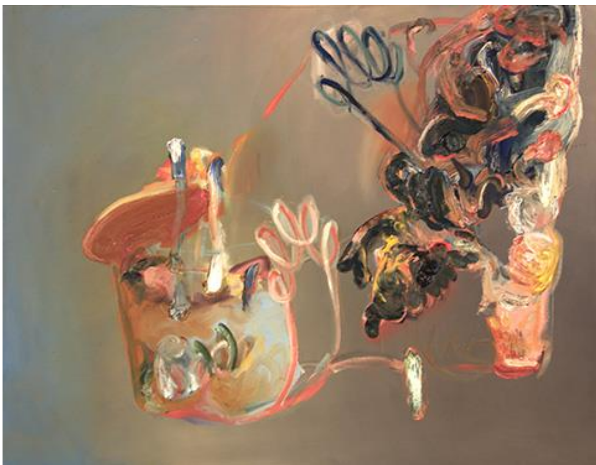
Myrto Christou, Abstract, 2019. Olieverf op doek, 71 x 90 cm.