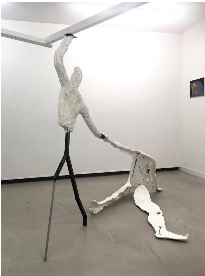
Zahar Bondar, Waiting Room, 2019. Gips, beton, metaal, een stoel, 3 x 3 x 2 meter.

Dat een Garden of Drawings ook uit andere media dan potlood op papier kan bestaan, laten de sculpturale objecten van Jorge Luis Barragán Castaño zien. De tekening is voor hem een manier om gedachten te materialiseren in verschillende media met contrasterende kwaliteiten. Delicate waterverf biedt bijvoorbeeld tegenwicht aan zware sculpturale vormen. De traditionele opvatting over wat een tekening is, maakt zo plaats voor een eigen kijk op de materie.