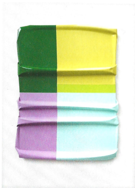
LINKSBOVEN Bumper Block.